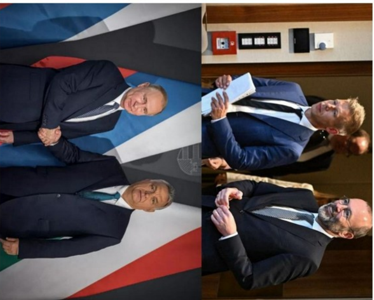
Az igazság szava

Minél több polgára él a polgári bátorsággal egy országnak, annál kevesebb hősré van szükség! [ Franca Magnani ]